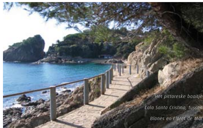
Het pittoreske baaitje Cala Santa Cristina, tussen Blanes en Lloret de Mar