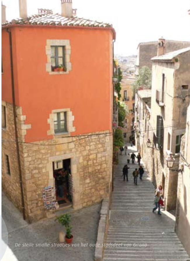
De steile smalle straatjes van het oude stadsdeel van Girona